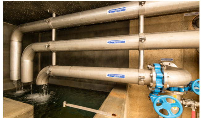
Dräi Quelle ginn um Cloosbiérg ugezaapt an dës Waasser geet virun op den Hondsbérg geleet. An Zukunft leeft d'Waasser iwwert eng Opbereedungsstatioun an dem Hondsbérg op Beefort an den neie Basseng op der Heed.