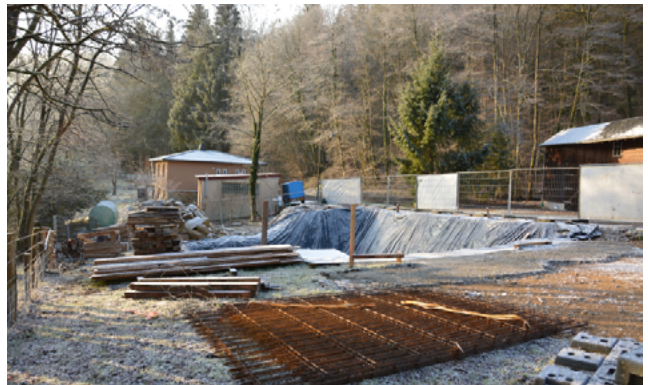
Um Cloosbierg entsteht eng modern Waasseropbereedungsanlag fir d'Quelle vum Cloosbierg. Enn des Joer wäert se fäerdeg sinn a wäert fir eng ausgezeechent Waasserqualitéit suergen.