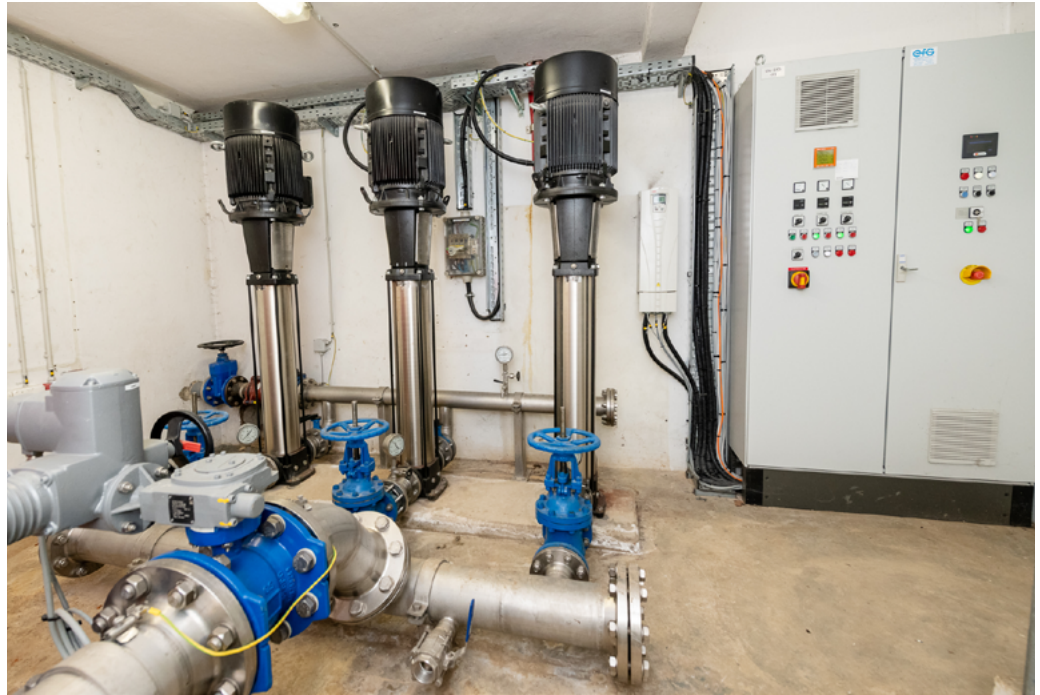
Dräi Pompele garantéieren, datt Beefort mam Waasser aus dem Mëllerdall versuergt gëtt.

efaassung um Cloosberg suergt eng Stroumbatterie, datt d'Chloréierungsanlag funktionéiert. D'Batterie gëtt all Woch ersat an nei opgelueden a bei där Geleeënheet gëtt de Reschtchlorgehalt an den zwee Réseae gemooss an iwwerwaacht.