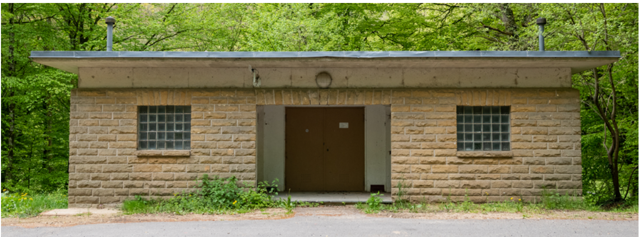
D'Pompelstatioun op der Vugelsmillen.

Aktuell gëtt Chlor an d'Drénkwaasser fir de Grondhaff an Déiljen zougefëgt. Dëst wier net onbedéngt néideg an et ass just eng Sécherheetsmoossnam. D'Chloréierungsanlag braucht Stroum, deen et awer op den zwou Plaze net gëtt. Eng Solaranlag steet iwwert dem Basseng vum Grondhaff a bei der Quell-