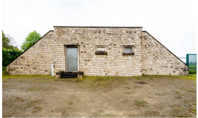
D'Waasser aus dem Mëllerdall kënnt an de Basseng op der Heed (Foto lenks). De Basseng um Fléiberg (riets) versuert den ënneschten Deel vum Duerf mat Waasser a reguléiert den Drock an de Leitungen.