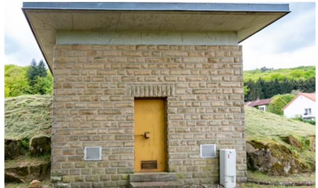
Um Cloosbiérg gëtt et och eng Chloréierungsanlag an där hir Batterie gëtt all Woch gewiesselt. Vum Cloosbiérg kënnt d'Waasser an de Basseng um Hondsbérg zu Déiljen.