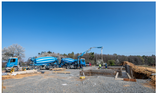
Den neie Waasserbasseng op der Heed. Dëse Projet vun iwwer dräi Milliounen Euro gehéiert zum Häerzstéck vum zukünftege Waasserréseau an der Gemeng Beefort, deen och eng interkommunal Aufgab wäert iwwerhuelen.