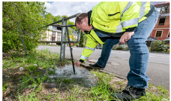
All Woch gi Waasserprouwe vu verschiddene Plazen am Waasserréseu zu Déiljen an um Grondhaff geholl. Gemooss gëtt de Reschtchlorgehalt.