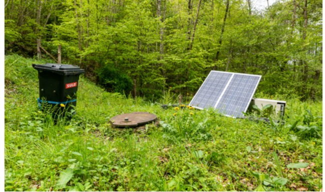
D'Quellefaassung mam Waasserbasseng fir de Grondhaff huet ee Volumen vun zéng Kubikmeter a gouf 1984 erbaut. Uewendriwwer ass eng Solaranlag fir d'Chloréierungsanlag.