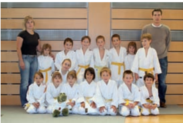
Gruppenfoto der angetretenen Judokas der gelb und gelb-weiß Gurte des Judoclub Beaufort