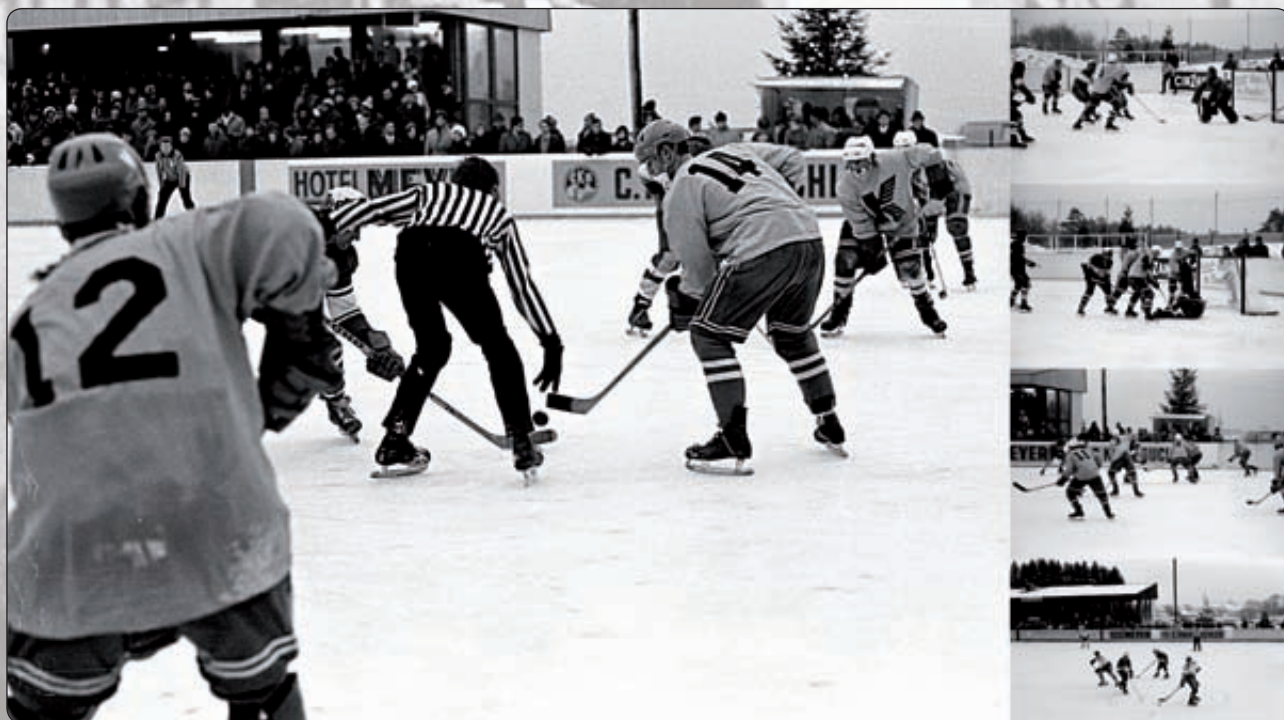
Eishockeymatch Den Haag (NL) géint Klotten (CH) den 28.12.1969 zu Beaufort.